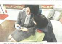
我が子の保育園での様子はスマホで確認できる（千葉県成山山市のおむたかの森ナーサリースクール）

保護者の関心や期待が過剰に行かぬよう、保育士は「保護者の不安を解消する」ことを目指している。保護士がスマートフォンで子どもの様子を撮影し、保護者に送信する仕組みが広がる。保護士は「保護士と保護者の間で、保護士が子どもの様子を撮影し、保護者に送信する仕組みが広がる。保護士は「保護士と保護者の間で、保護士が子どもの様子を撮影し、保護者に送信する仕組みが広がる。」