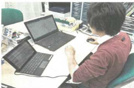
日本ユニシスは指通計画の作成などを管理で多シズテムで業務効率化を支援し、チャイリフスペースは園児の発達の様子を体系的に把握できる。